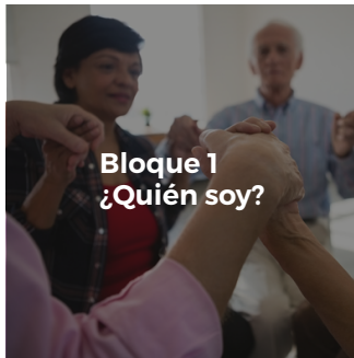
Bloque 1 ¿Quién soy?

Estos encuentros se dividen en 3 bloques :