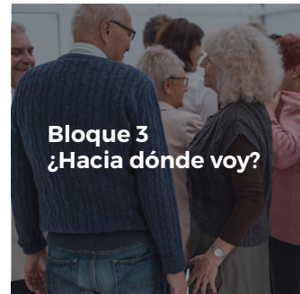
Bloque 3 ¿Hacia dónde voy?